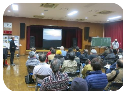
“観賞するあすなろ生”