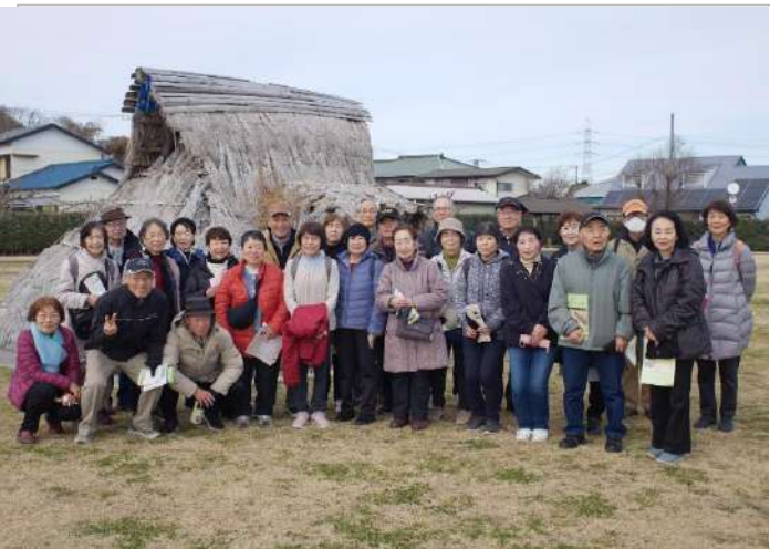
住居跡の前で全員集合