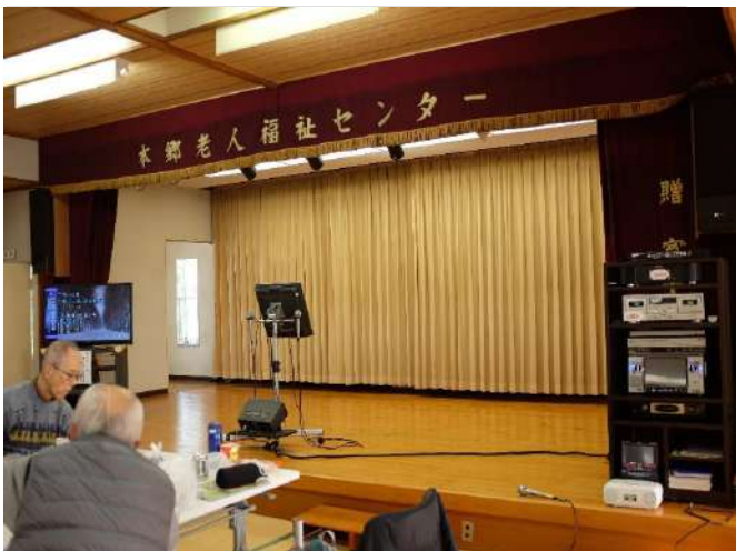
これからのど自慢を迎えるまだ静かな舞台