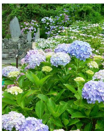
Yoritomo- japan.com2020/6 以前引用 御霊神社紫陽花小道