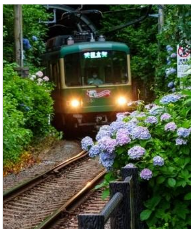
Kamakura- wakamiya.jp2024/6/17 引用 江ノ電沿線